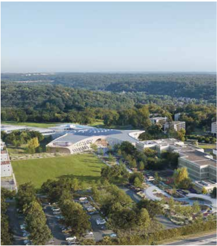
Page de gauche Vue aérienne du Cœur de campus