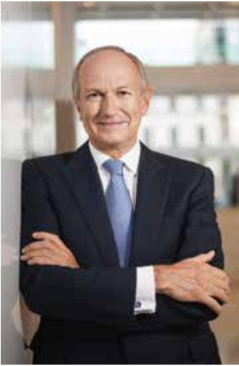
Jean-Paul Agon (H.78), Président du Conseil d'administration d'HEC Paris

« Ce projet, c'est notre grande aventure collective pour les décennies à venir. L'histoire commence maintenant, et elle s'écrira en grand si nous sommes toutes et tous au rendez-vous. »