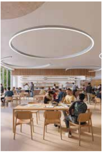
Page de gauche (en haut) Cafétéria