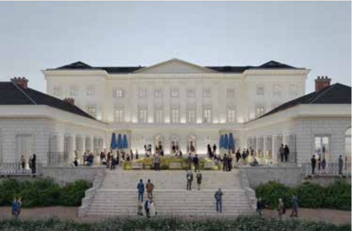
Page de droite (en bas) Mise en valeur de la cour intérieure du Château